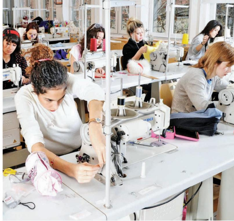
Ekonomik veriler ve güven ortamı yükseldikçe giyim sanayisi de olumlu şekilde etkilendi.